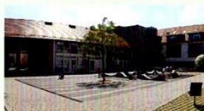
Mehrgenerationen- und Bürgerhaus Pliensauvorstadt in der Weillstraße 8

Informationen über unsere Arbeit und aktuelle Stadtteilthemen bekommen Sie am einfachsten auf unserer Webseite (Adresse auf der Rückseite). Sie können uns auch kontaktieren, wenn Sie Fragen oder wichtige Anliegen bezüglich des Stadtteils haben. Wir suchen außerdem regelmäßig Unterstützung bei Projekten (z. B. zum Stadtteilstfest).